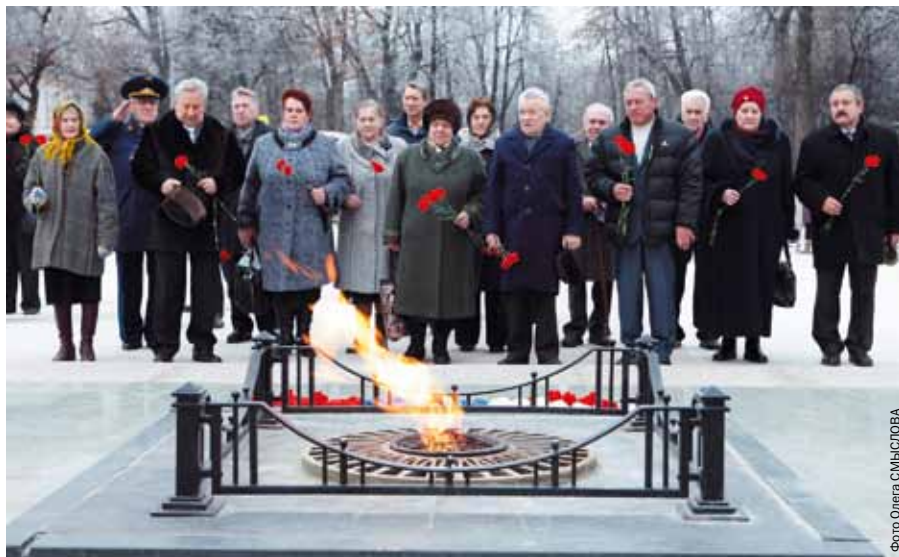
Герои у Вечного огня

В следующем году в Ярославле на базе гарнизонного Дома офицеров начнет работу центр патриотического воспитания. Уже сегодня ярославские общественники думают о том, чем заполнить площади будущего центра. Среди предложений есть и такое: