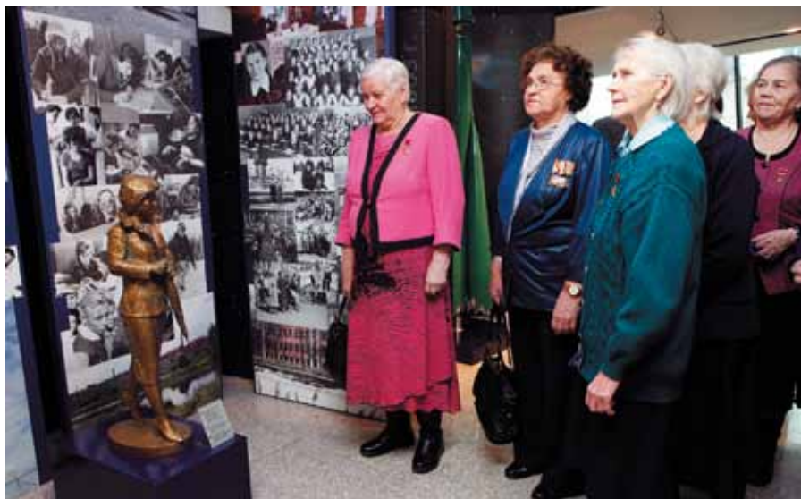
В планетарии на экскурсии.

Первым героем в новейшей истории нашей страны, получившим звание Героя Российской Федерации, стал генерал-полковник Сергей Макаров. Он был удостоен этой высочайшей награды в 2008 году за мужество, проявленное во время службы в Северо-Кавказском регионе.