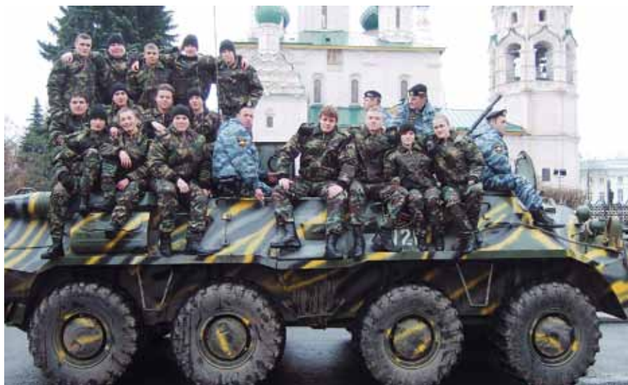
Парад к Дню милиции. Ярославль, 10 ноября 2010 года.

Ведь молодые люди никогда не существуют в вакууме, в отрыве друг от друга.